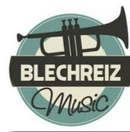
BlechReiz BrassQuintett live - Show must go on (Queen)