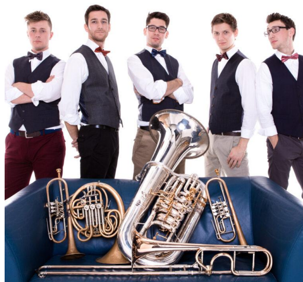
"Adiende Agudo" BlechReiz BrassQuintett live im SWR

Un concert du BlechReiz BrassQuintett, c'est une expérience unique, un véritable régal pour tous nos sens et pour le cœur.